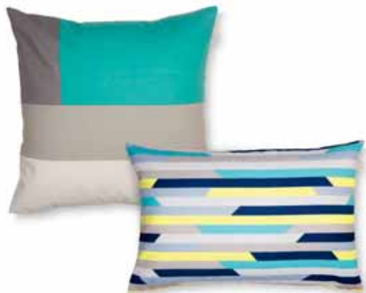
CUSHION COVER BLOCK 45 x 45 cm € 22,99 CUSHION COVER SLOW 38 x 58 cm € 22,99