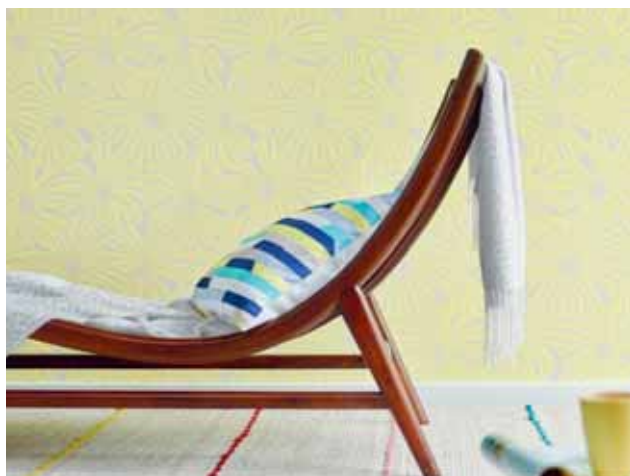
WALLPAPER PLAY IN SUMMER 5,33 qm € 21,95 - € 23,95