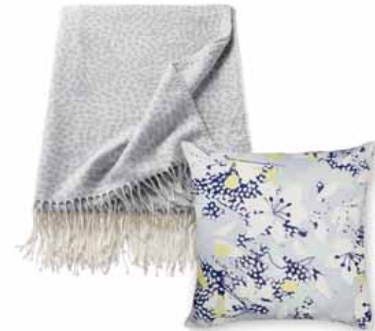
PLAID PET 150 x 200 cm € 79,99 CUSHION COVER FELA 45 x 45 cm € 19,99