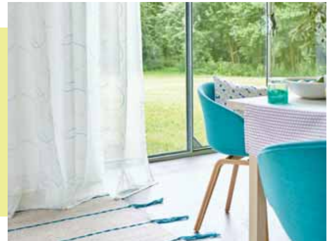
TABLE RUNNER PATI 40 x 140 cm € 24,99 CURTAIN OLIV 140 x 250 cm € 45,99