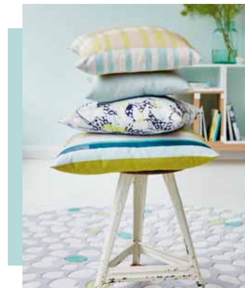
CARPET FLUTTERY rd. 200 cm € 959,00 CUSHION COVER FELA 48 x 48 cm € 19,99 CUSHION COVER LIRO 38 x 58 cm € 22,99