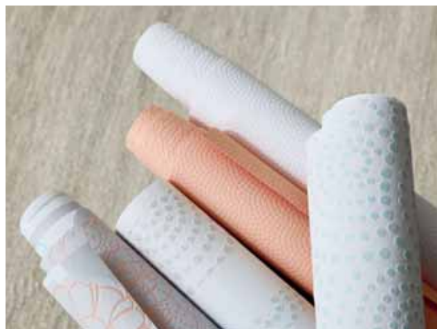
WALLPAPER DREAM OF SPRING 5,33 qm € 20,95 - € 22,95