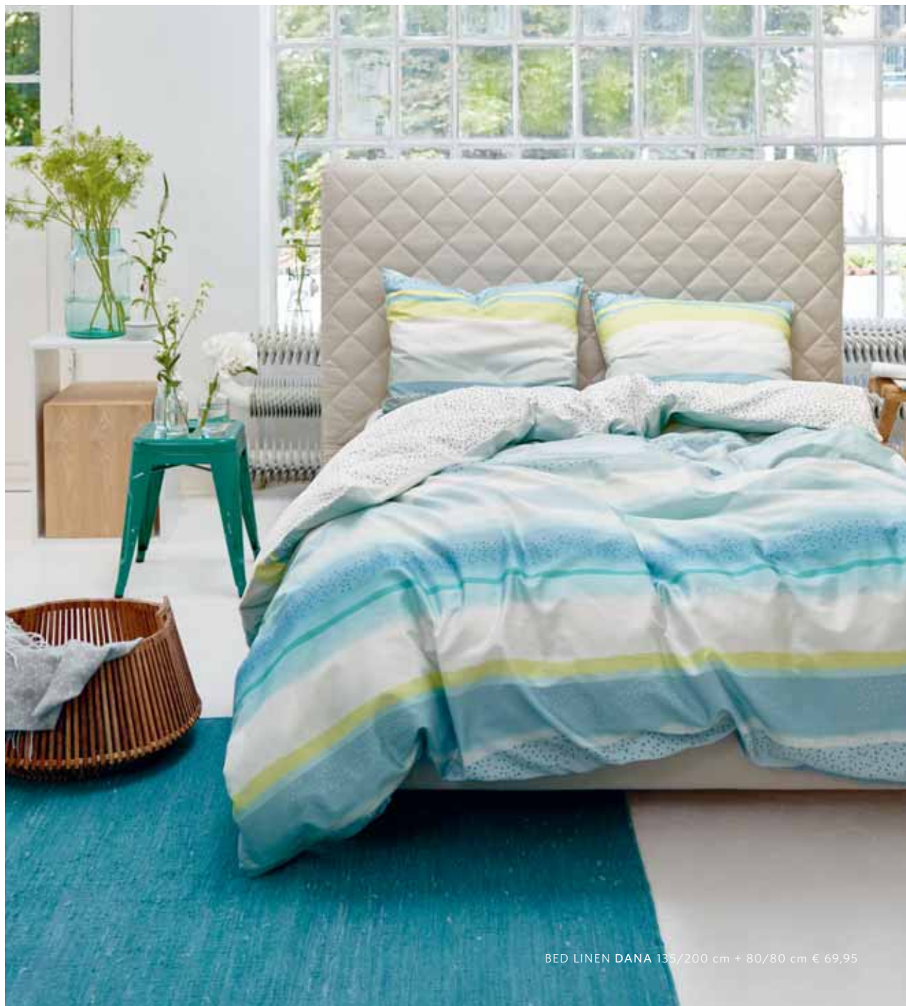
BED LINEN DANA 135/200 cm + 80/80 cm € 69,95