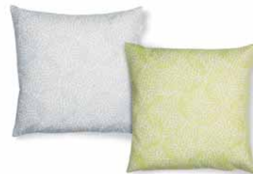
CUSHION COVER LIV 38 x 38 cm € 15,99