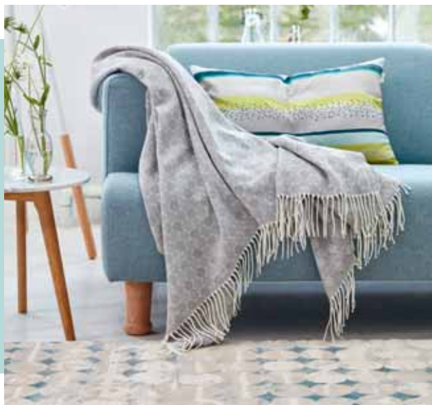
PLAID DORO 150 x 180 cm € 49,99 CUSHION COVER LIRO 38 x 58 cm € 22,99