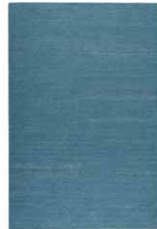
KELIM RAINBOW 160 x 230 cm € 399,00