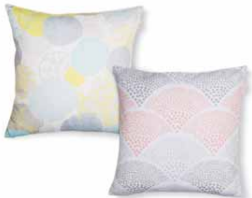
CUSHION COVER MIKA 45 x 45 cm € 19,99 CUSHION COVER MALA 38 x 38 cm € 17,99