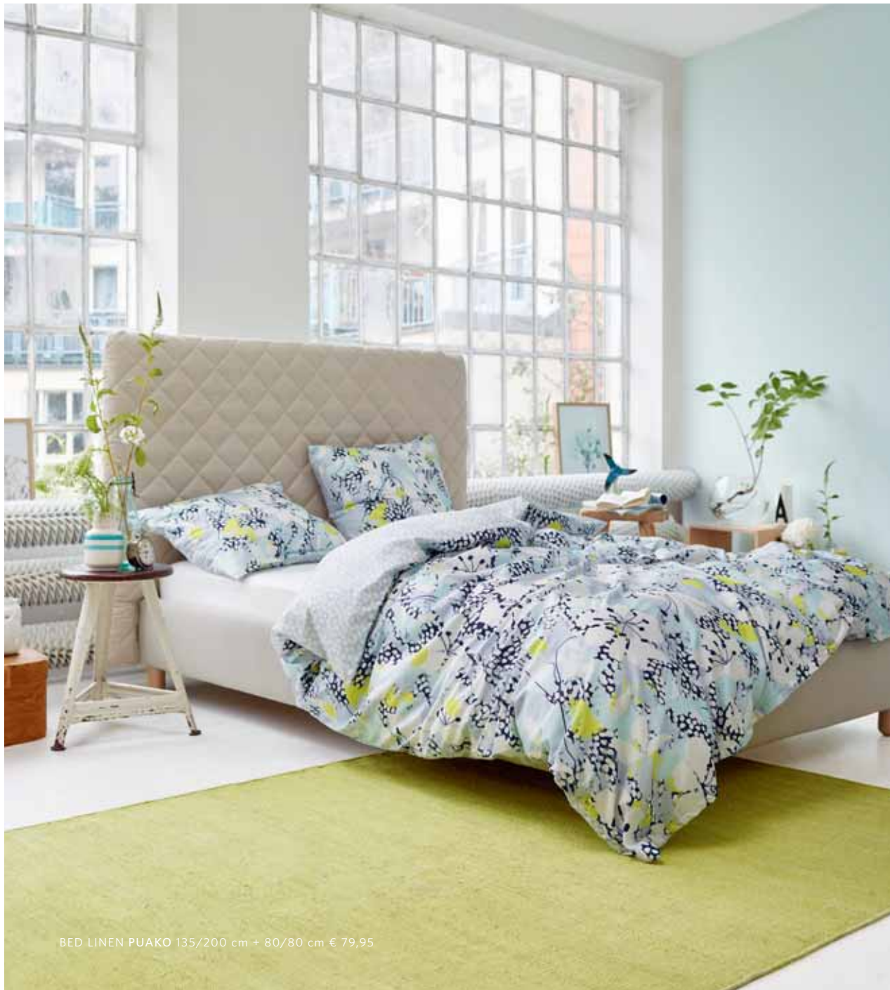
BED LINEN PUAKO 135/200 cm + 80/80 cm € 79,95