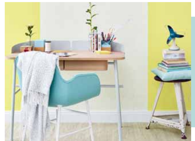
WALLPAPER DREAM OF SPRING 5,33 qm € 20,95 - € 22,95