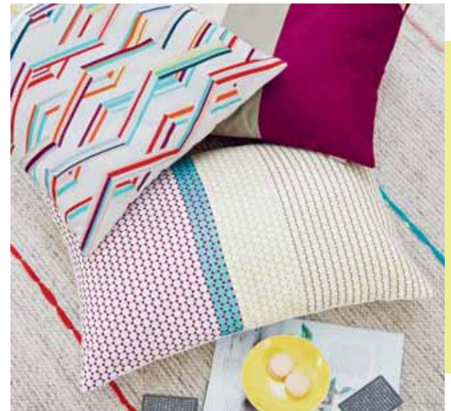
CUSHION COVER CORO 45x45 cm € 19,99 CUSHION COVER BLOCK 45x45 cm € 22,99 / PATI 38x58 cm € 22,99