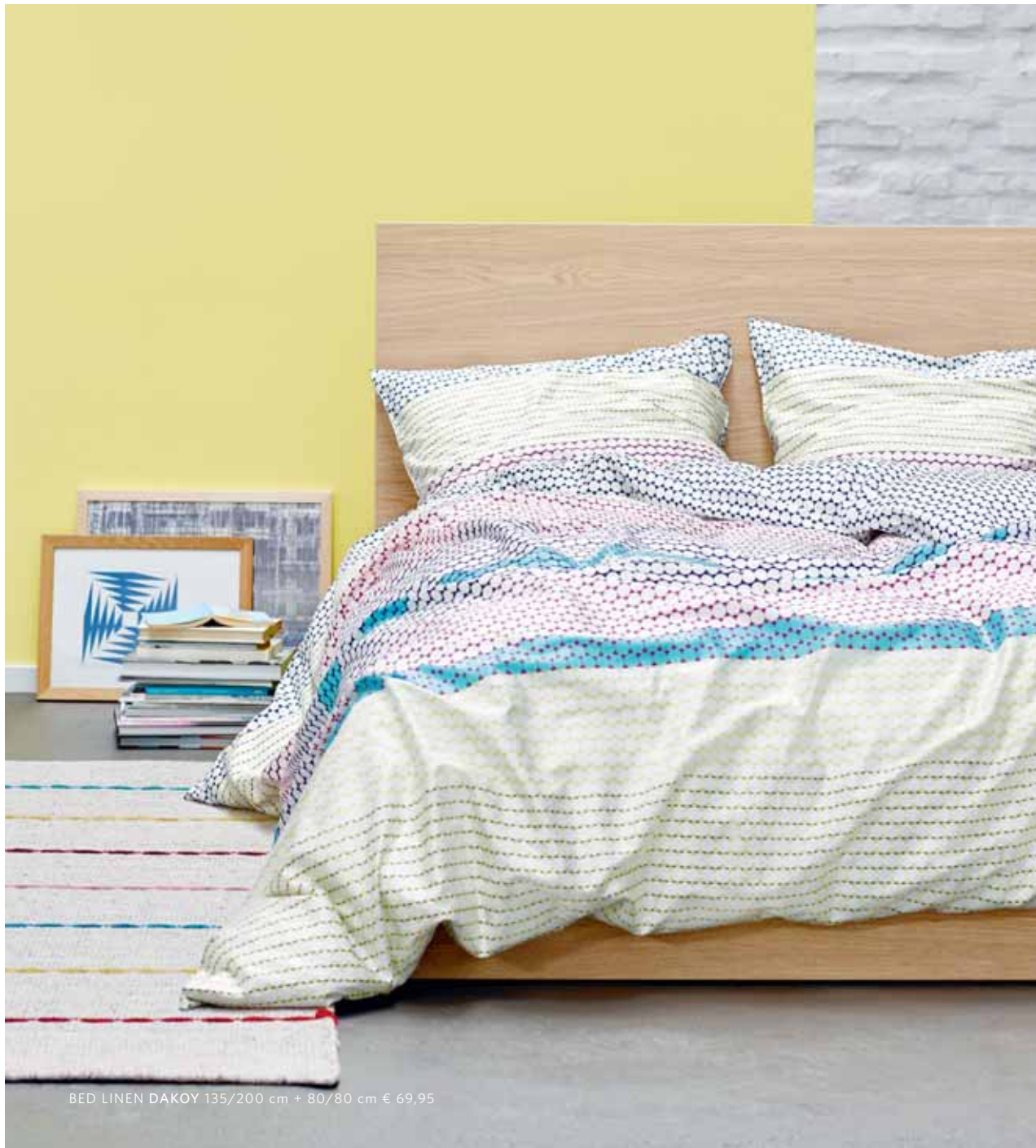
BED LINEN DAKOY 135/200 cm + 80/80 cm € 69,95