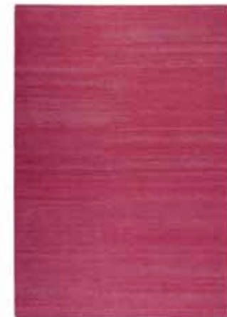
KELIM RAINBOW 160 x 230 cm € 399,00