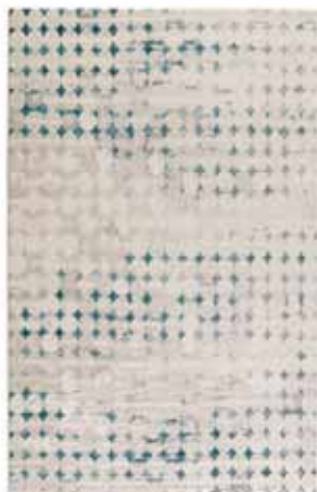
CARPET VELVET SPOTS 160 x 225 cm € 269,00