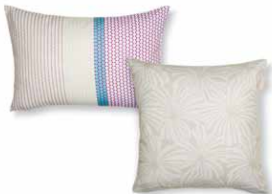
CUSHION COVER PATI 38 x 58 cm € 22,99 CUSHION COVER FARA 38 x 38 cm € 19,99